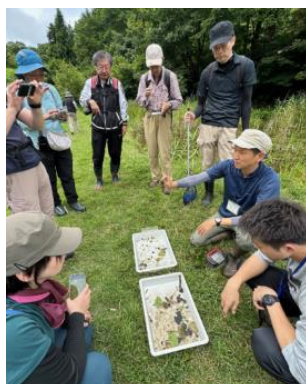
魚沼コース 「キョロロ」