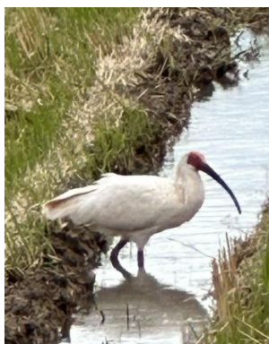
佐渡コース 「佐渡島のトキ」