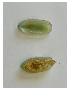
古生物学コース 「ミドリシャミセンガイ」